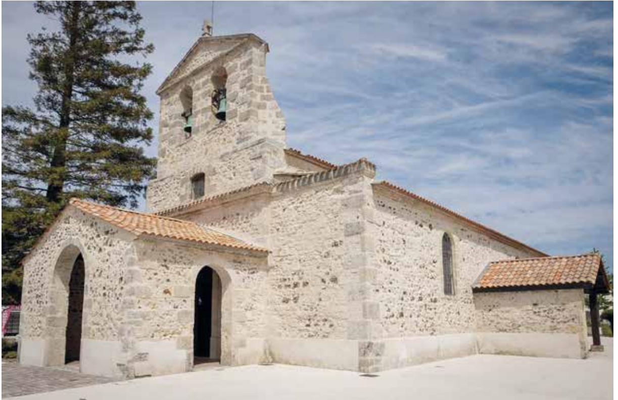
► ÉGLISE SAINT VINCENT

■ L'équipe FCPMH de Castets des Landes s'est réunie le samedi 30 avril 2022 (5 participants) et elle a repris le questionnement de la démarche synodale, qu'elle nous partage.