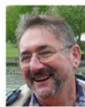
Claude au début